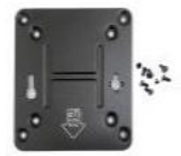
Kit de Montaje VESA