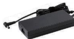
Adaptador de corriente